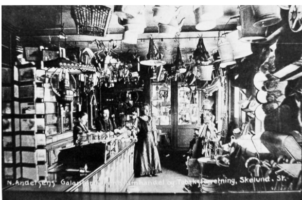
N. Andersens Galanteri - Isenkramhandel og tobaksforretning i Skelund