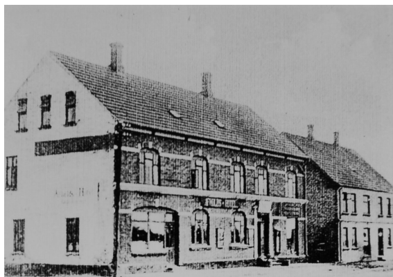
Hotellet i Skelund