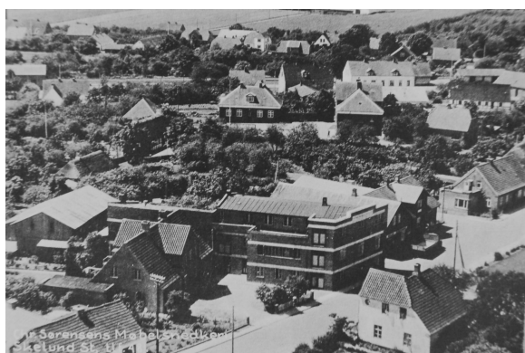
Chr. Sørensen's Møbelfabrik i Skelund