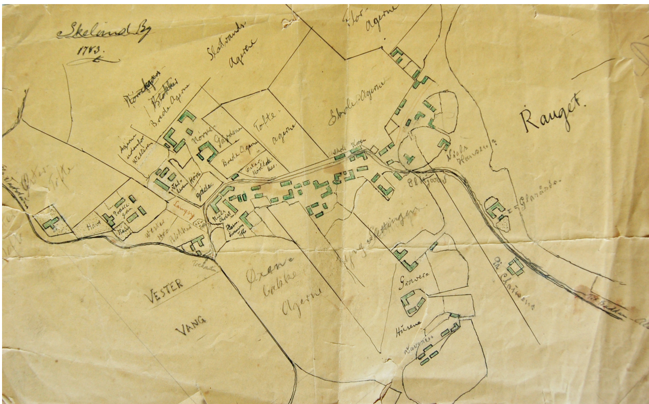
Stort kort af Skelund by, tegnet i 1743