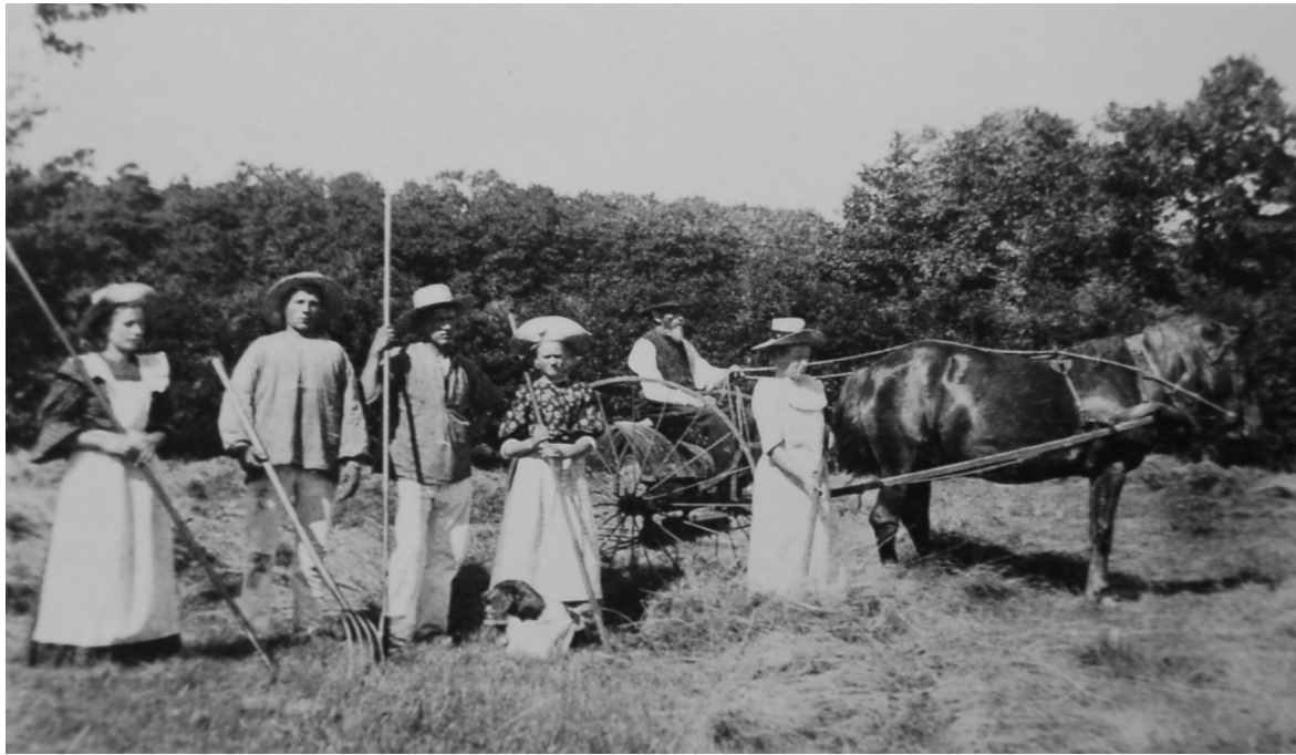
Markarbejde med høet - engen i Skelund 1910