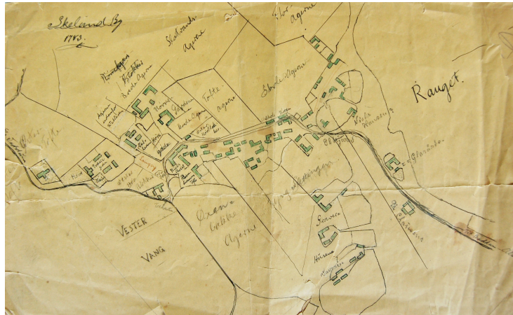
Kort over Skelund fra 1743