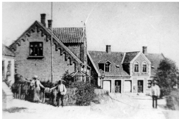
Hovedgaden i Skelund